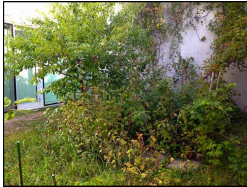
École des ouches Jardins du bas